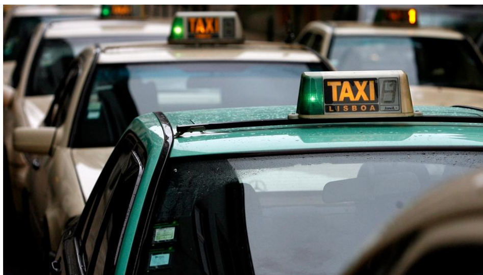
Veículos ligeiros de passageiros de aluguer - Táxis (Certificação de Motorista de Táxi - C.M.T.)