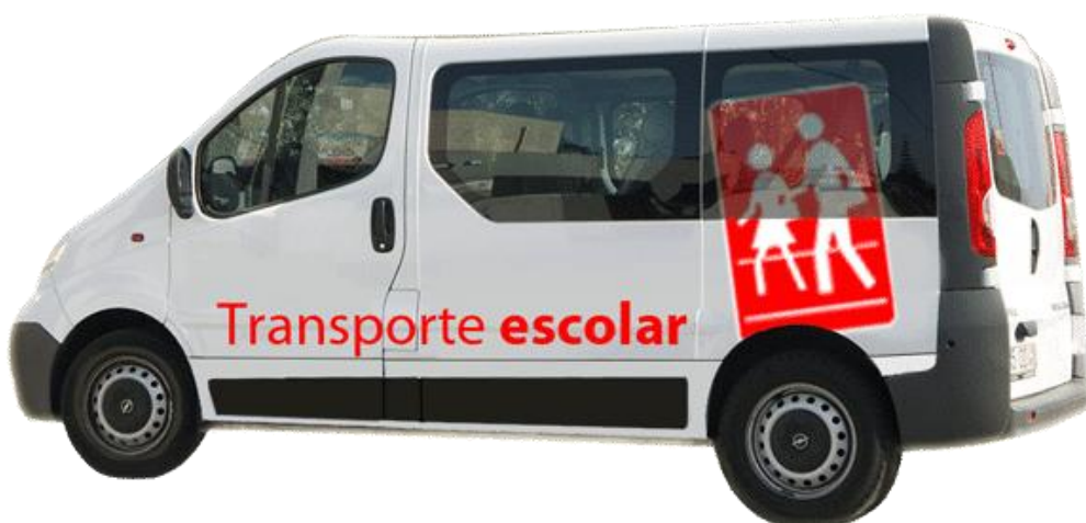
Veículos de Transporte Escolar