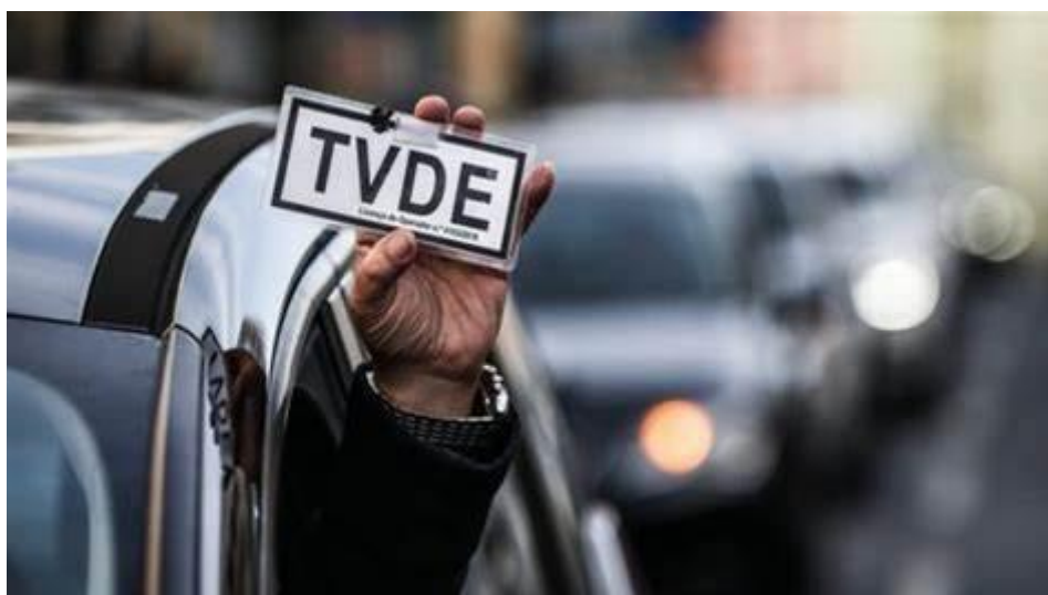
Veículos de transporte individual e remunerado de passageiros em veículos descaracterizados a partir de uma plataforma electrónica (T.V.D.E.)