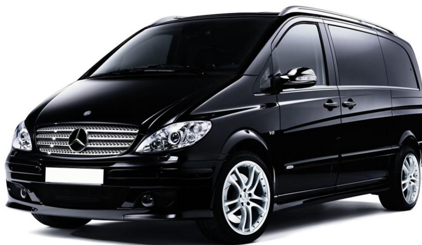
Veículos de Turismo, Transferes, Âmbito Privado