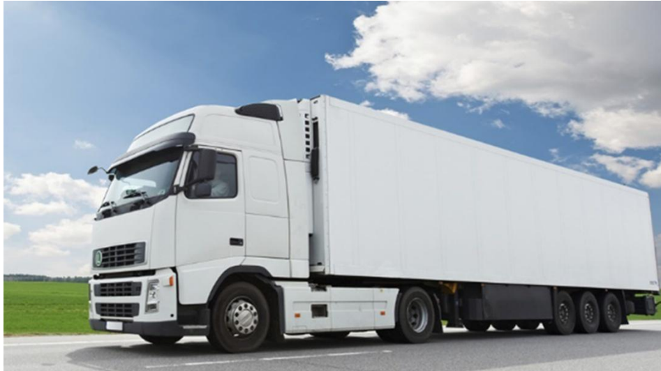
Pesados de Mercadoria