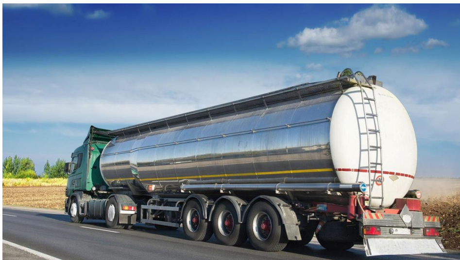
Veículos de Transporte de Matérias Perigosas (A.D.R.)