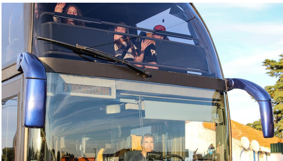
Veículos de Transporte Colectivo de Crianças (T.C.C.)